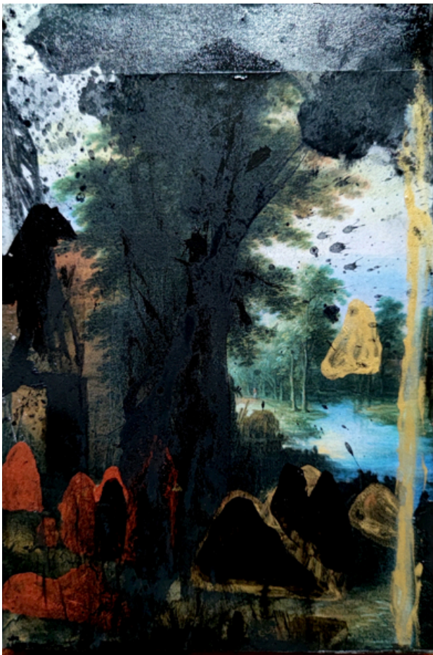
Arcangelo Paesaggio 2022 Tecnica mista su tela - cm 30 x 20

Per la Galleria Mazarine Variations, Arcangelo ha progettato una mostra radicalmente e profumatamente fiorita e drammaticamente lignea e flessuosa: "Fiori Irpini", "Fiori di Croco", e "Ulivi" tele nate nel suo studio di San Nazario in provincia di Benevento, luogo, per l'artista, ideale , in cui sempre trova radici per le sue opere. Saranno esposte anche piccole tele, "Paesaggi", un rimando sognante e poetico della tradizione pittorica del paesaggio, rivista da Arcangelo, e come piccole case sacrali, le preziose ceramiche, "Casa Dogon", che saranno il luogo intorno al quale vive il suo mondo visionario e terroso, ceramiche nate per il suo forte legame alla terra africana, meta di tanti suoi viaggi, che, per atmosfere e odori, è così vicina a quel sud dell'Italia a lui caro.