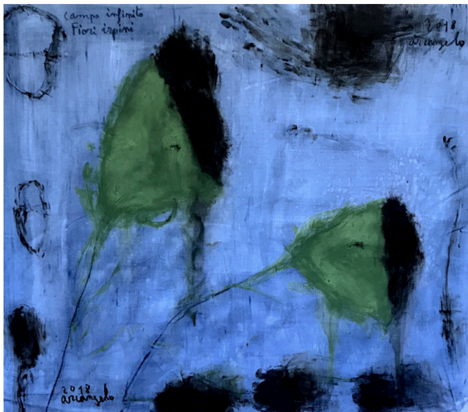
Arcangelo Campo Aperto Fiori irpini , 2018 Tecnica mista su tela - cm 90 x 104

Oltre alle numerosissime mostre personali e collettive nei più importanti centri italiani e internazionali negli anni sono stati editi numerosi volumi monografici e libri sulla sua arte anche in collaborazione con diversi poeti italiani tra cui Alda Merini, Maurizio Cucchi, Maurizio Medaglia.