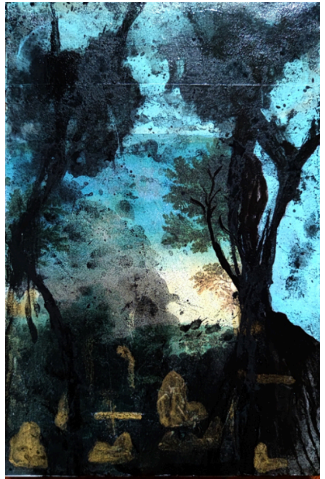
Arcangelo Paesaggio 2022 Tecnica mista su tela - cm 30 x 20