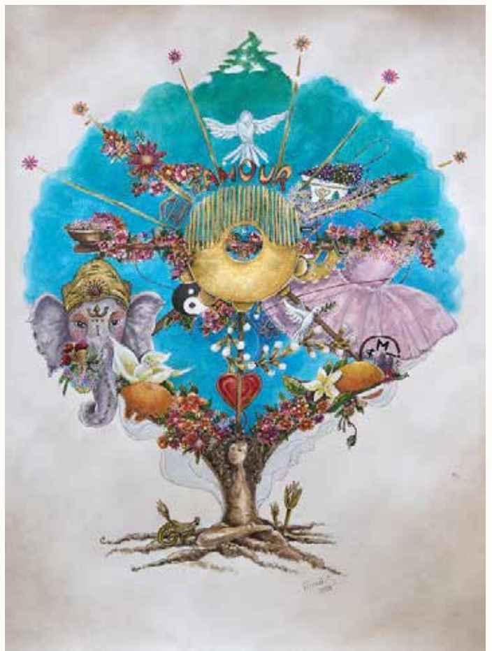
Arbre de Vies, Stéphanie Farhat (2023)