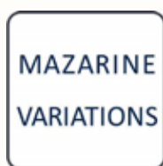
Galerie Mazarine Variations